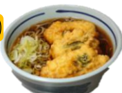
梅しそとり天そば